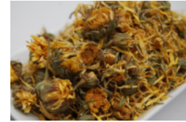
マリーゴールド (乾燥花)