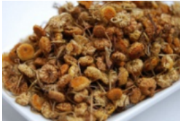
カモミール (乾燥花)