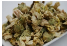
ウスベニタチアオイ (乾燥花)