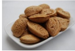
アーモンド (オイル)