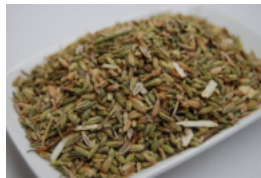
ウイキウ(フェンネル) (乾燥種子)