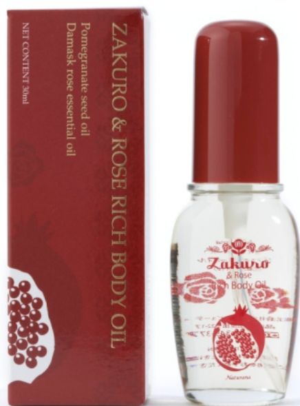
ざくろ&ローズリッチボディオイル 30ml 定価¥7,350円(税込)

オイル特有のべたつきもなく、肌馴染みの良さに加え、 防腐剤や化学成分は一切使用していない ことも、大きな特徴です。まさに、植物成分100%のチカラでエイジング肌への集中トリートメントをしてみたいかがでしょうか。